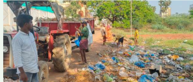
కోట స్వర్ణసాగరం ఏప్రిల్ 13